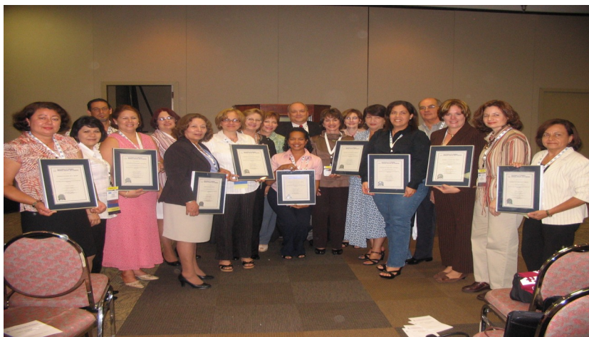
Conferencia Anual ACBSP en junio de 2007 en Florida, USA. El Programa de Administración de Empresas de la UPR-Ponce obtuvo su certificado como candidato a la acreditación ACBSP.