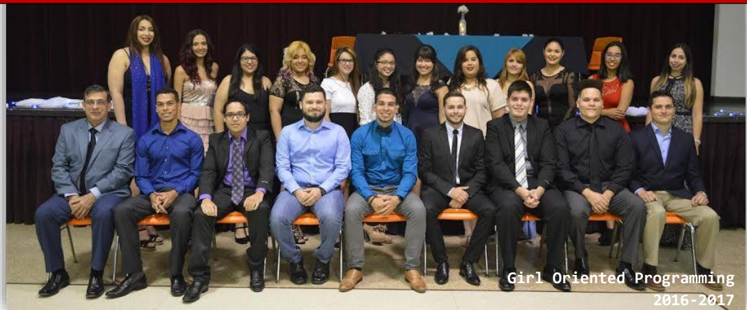
Girl Oriented Programming 2016-2017

Girl Oriented Programming llevó a cabo sus primeros Actos de Iniciación como Asociación Estudiantil de la UPRP. La actividad se llevó a cabo el 4 de noviembre de 2016 en el Teatro General.