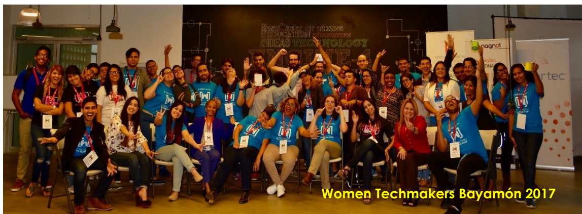
Women Techmakers Bayamón 2017