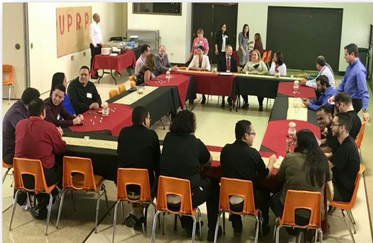
Confraternización Visita ABET Estudiantes, Egresados, Facultad, Comité Asesor, Administración (30 de enero de 2018)