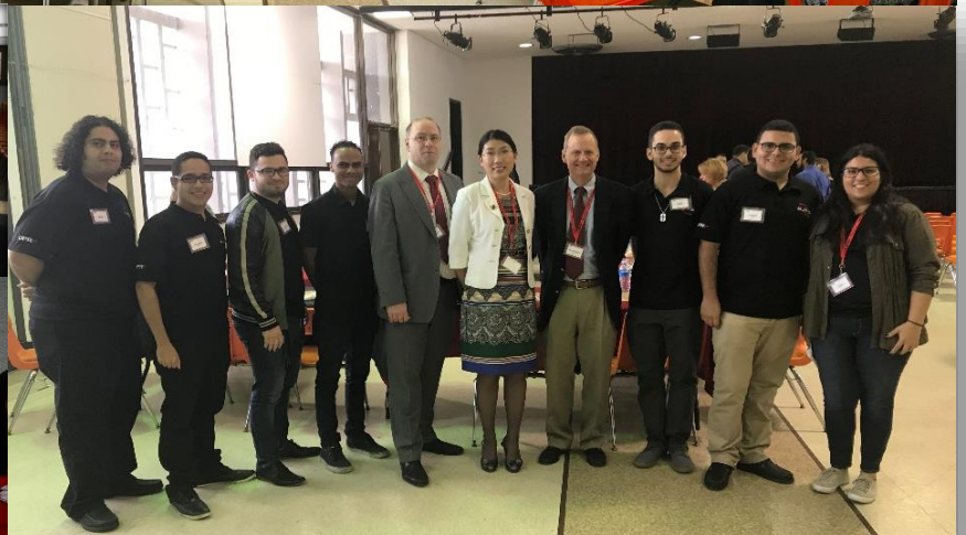
Un grupo de 7 estudiantes participó como ujieres, ayudando durante la visita en la logística del Comité.